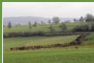
VOEREN (34 bomen)