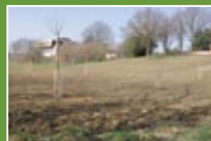
LINDEN (25 bomen)