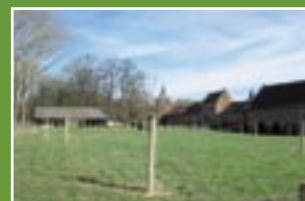
NIUWERKERKEN BIJ SINT-TRUIDEN (35 bomen)

Het voorbije plantseizoen heeft onze zustervereniging, de Natuur en Boomgaarden Sociale Werkplaats (NBSW vzw) weer talrijke aanplantingswerken verricht, zowel in opdracht van particulieren als van een aantal Regionale Landschappen. Dit over heel Vlaanderen. Conform de wensen van de klant en de aard van de omgeving, heeft elk project als het ware een eigen karakter en wordt dan ook professioneel en doordacht aangepakt.