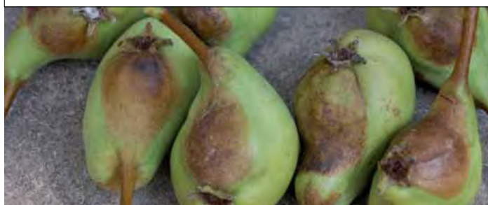
Door zonnebrand is een deel van de ontwikkelende vrucht beschadigd en daardoor volledig in groei achtergebleven.

Deze peer, in verrier-palmet geleid aan draad, en staande op zuiden is in de maanden mei en juni rijkelijk aan het volle zonlicht blootgesteld geweest met bijgaand resultaat. Een zijde van de ontwikkelende vrucht werd door de zonnebrand beschadigd, a.h.w. verbrand en is in groei volledig achtergebleven op de rest van de vrucht. De onbelichte vruchtzijde daarentegen heeft een quasi normale ontwikkeling gekend. Het resultaat is een scheve, misvormde kleinere of zeer kleine vrucht, waardeloos voor gebruik. Gezien deze vruchtjes toch voedingsstoffen aan de moederplant blijven onttrekken, kan men ze best zo snel mogelijk verwijderen. (L.R.)