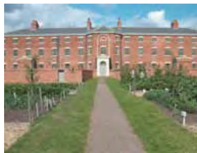
The Workhouse" ooit een laatste reddingsboei van de allerarmsten.

Een zevendaagse reis met een Alkbus, overtocht Zeebrugge - Hull in tweepersoons binnenhutten op de heenreis, overtocht Dover - Calais op de terugreis, Engels ontbijt, driegangendiner en lunch op dag twee, drie, vier en zeven, alle toegangsgelden, gidsbeurten Chatsworth (tuin) - Workhouse (audiogids) - Calke Abbey - Lyveden New Bield - Stowe Landscape Garden - Wisley Garden - Brogdale Collections, Adrian Baggaley's fruit- en groentetuin, fooi chauffeur, lokaal transport Guidford/Wisley Garden en terug, overnachtingen in Holiday Inn Hotels op basis van tweepersoonskamers, annulatie-, bijstand- en bagageverzekering, bijdrage Garantiefonds Reizen, een beknopte reisbrochure.