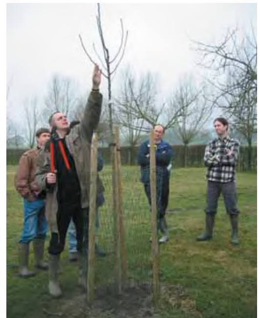
Vormsnoei, niet enkel een groepsles maar tevens de kans voor persoonlijke en gedetailleerde instructie.

Vorig seizoen werd appelsap geperst van een mengsel van appelrassen uit de NBS-Enkelenbergboomgaard in Vliermaal. Natuurzuiver sap, afgevuld in 5 literbag-in-box verpakking. Dergelijke verpakkingen houden in gesloten toestand het sap ongekoeld voor 2 jaar en eenmaal geopend kan er gedurende een paar maanden aan een kraantje worden afgetapt. Hetzelfde systeem als toegepast bij wijn, op gelijke wijze verpakt, waarbij de inhoud continu steriel blijft tijdens het gebruik. Het was een uitzonderlijk appeljaar en de kwaliteit van dit ongefilderde sap is dan ook voortreffelijk. We hebben een aantal boxen in voorraad die te bekomen zijn op het NBS-secretariaat aan de prijs van 10 euro/5 liter-box.