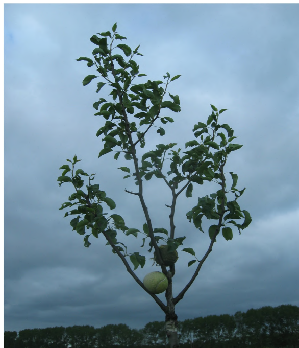
Hier werden voor het uitbuigen enkele tennisballen gebruikt. Origineel en goedkoop