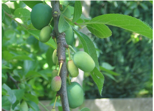
Vruchtrui bij pruim, de kleine vruchtjes verkleuren reeds en zullen spoedig afvallen

Zo zie je maar weer dat ieder fruitjaar zijn goede en slechte kanten heeft.