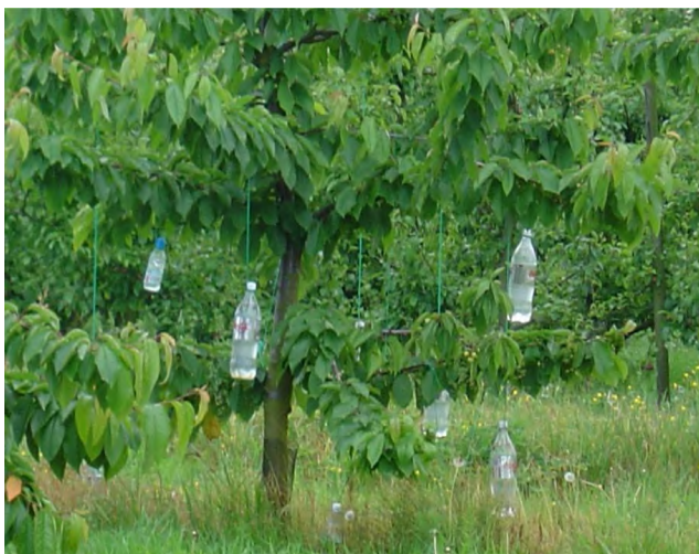
Met flessen gaat het ook, naargelang de stevigheid van de tak en de gewenste uitbuiging kan je meer of minder water in de flessen doen