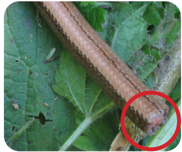
Stompje van een afgeworpen staart

Vijanden heeft de hazelworm helaas in overvloed. Hierdoor is het ook zo'n zeldzaam dier geworden in onze regio. Een van de grootste vijanden zijn wij als mens. Dit komt enerzijds door onze automatische veronderstelling dat het om een slang gaat die dood moet, anderzijds speelt het verkeer hier ook een rol. Andere vijanden zijn roofvogels, zoogdieren en andere reptielen, veelal carni- of omnivoren.