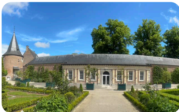
Orangerieterras en Franse tuin in Alden Biesen

De Sappmobiel® staat nog even op stal, maar we geven je nu al een voorlopig over- zicht van de eerstvolgende persdagen (p. 6). De meest recente aanpassingen aan de kalender zijn steeds op onze website terug te vinden.