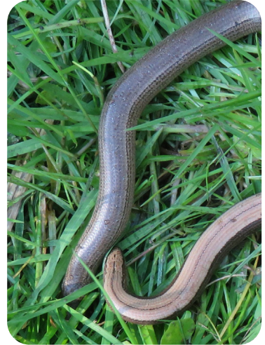
De hazelwormen in onze boomgaard

De hazelworm is een pootloze hagedis, die tot wel een halve meter lang kan worden. Tot tweederde van het lichaam bestaat uit de lange staart, die een opvallend stompe punt heeft. De naam van het diertje doet het al vermoeden, maar inderdaad heeft hij bruine kleur die vergelijkbaar is met hazelnoten. Op de rug bevinden zich enkele dunne, donkere strepen, soms bestaand uit rijen zeer kleine vlekjes. Bij vrouwtjes zijn deze strepen opvallend donkerder. Mannetjes krijgen dan weer blauwe vlekken op de rug tijdens de paartijd en zijn variabel van kleur, gaand van roodbruin tot grijs.